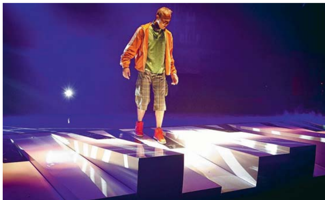
Voilà qui devrait vous donner un petit avant-goût du spectacle à ne pas rater.